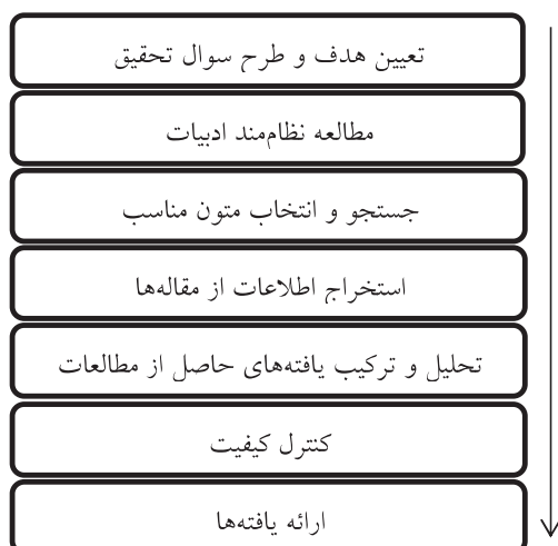
شکل (۱). گام‌های فراترکیب بر اساس روش هفت مرحله‌ای ساندلوسکی و بارسو (۲۰۰۶)

اصلی انتخاب پژوهش‌ها، ترکیب ترجمه‌ها و ارائه ترکیب را ارائه داده‌اند و همچنین، ساندلوسکی و بارسو ۱ (۲۰۰۶) روش هفت گامی را برای این منظور معرفی کرده‌اند. در این تحقیق برای دستیابی به اهداف پژوهش و پاسخ به سوال‌ها، از روش هفت مرحله‌ای ساندلوسکی و بارسو (۲۰۰۶) استفاده شد که به عقیده چنایل ۲ (۲۰۰۹) یکی از جامع‌ترین روش‌های انجام تحقیق با رویکرد فراترکیب است و مراحل آن در شکل (۱) مشخص شده و در ادامه به این مراحل بطور مبسوط اشاره شده‌است.