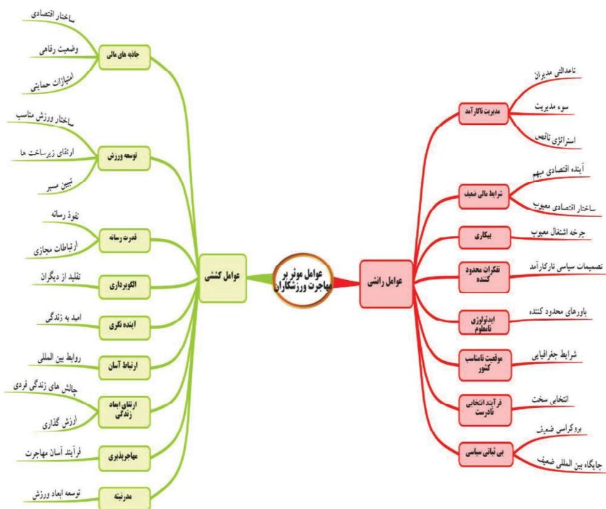
شکل (۳). مدل مفهومی عوامل موثر بر مهاجرت نخبه‌های ورزشی

در گام آخر، بعد از تجزیه و تحلیل و دسته‌بندی کدهای استخراج شده مدل مفهومی عوامل موثر بر مهاجرت ورزشکاران و نخبه‌های ورزشی با دیدی جامع و کل‌نگر ارائه گردید.